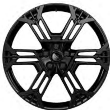
21" SNOWFLAKE 2 GESCHMIEDET, SCHWARZ MATT [ATELIER]