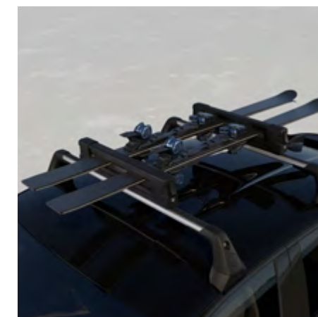
SKITRÄGER [FÜR 4 PAAR SKI] AUF DACHTRÄGER