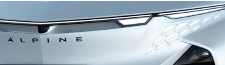
BLANC TOPAZE 1