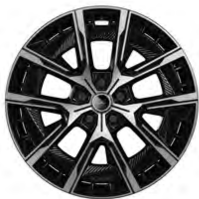
20" CRISTAL 1 DIAMANTGESCHLIFFEN, SCHWARZGLÄNZEND