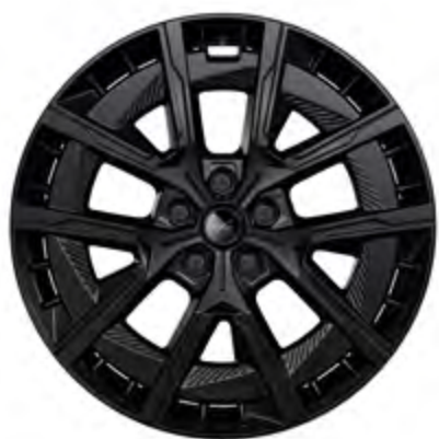
20" CRISTAL 2 SCHWARZ MATT [ATELIER]