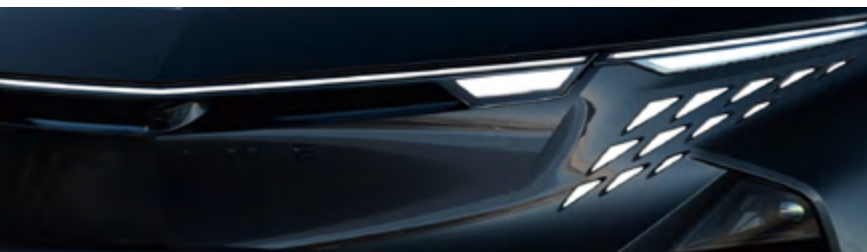
NOIR PROFOND 1