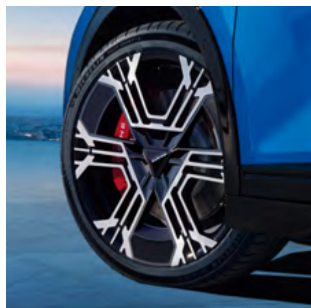
RAD-INLAYS [FÜR 21" FELGEN]