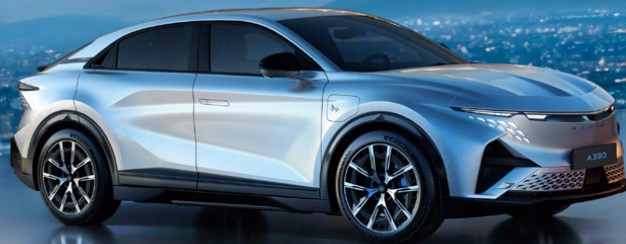
ALPINE A390 GT