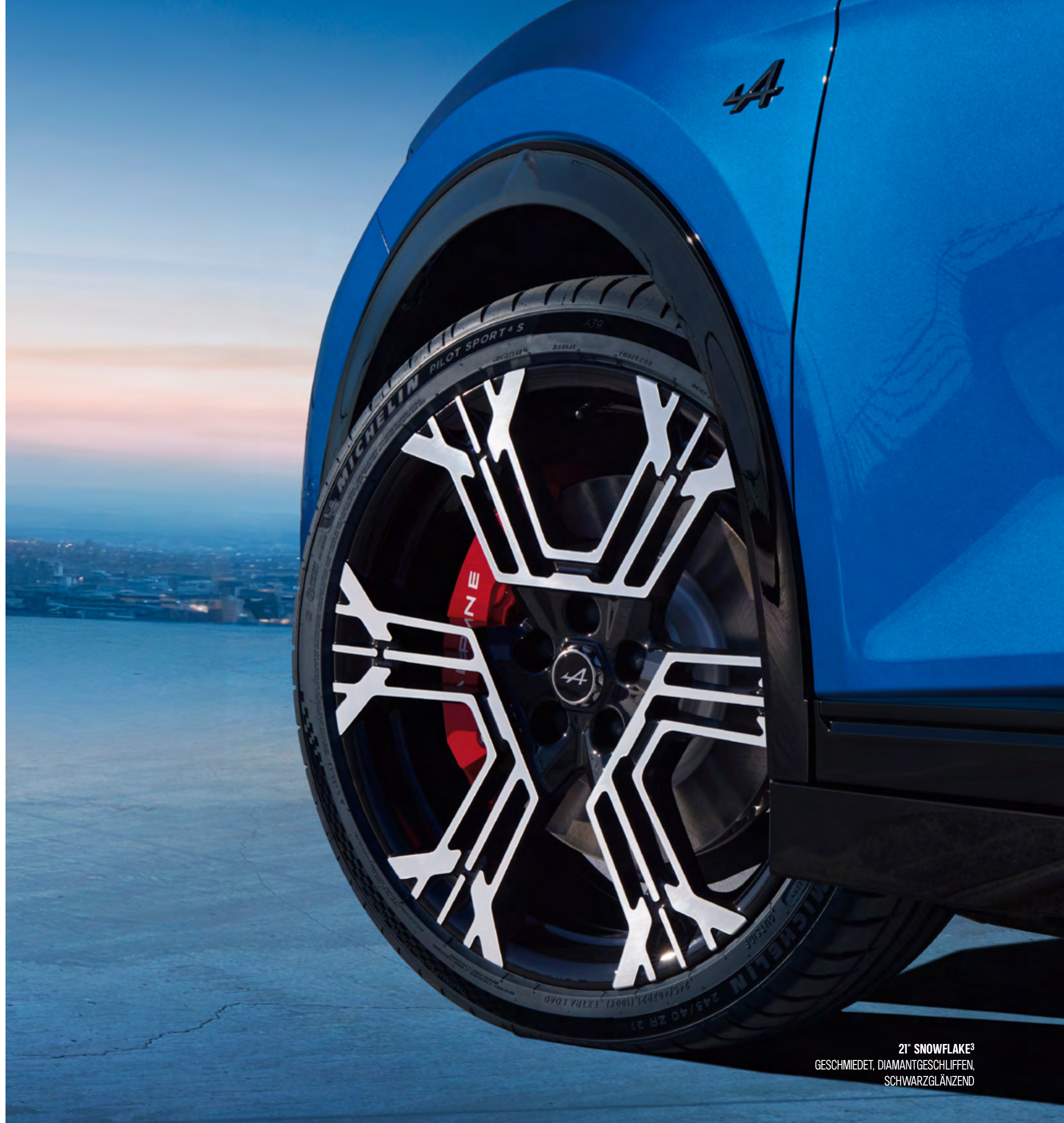
21" SNOWFLAKE 3 GESCHMIEDET, DIAMANTGESCHLIFFEN, SCHWARZGLÄNZEND