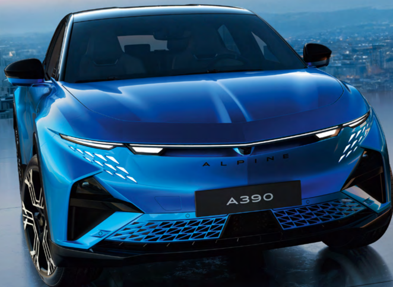
ALPINE A390 GTS*