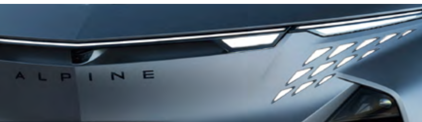
GRIS TONNERRE MAT 2