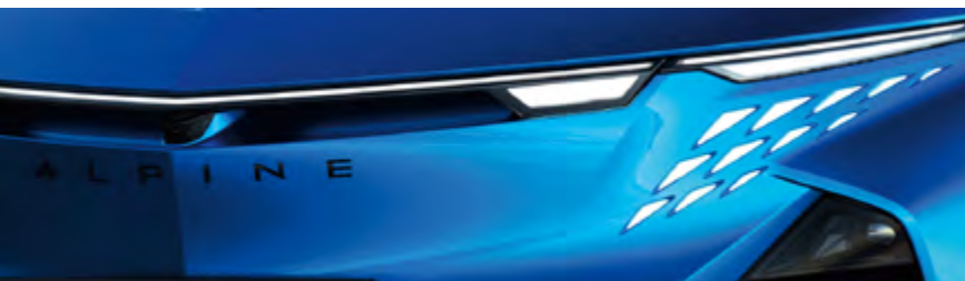
BLEU ALPINE VISION 1