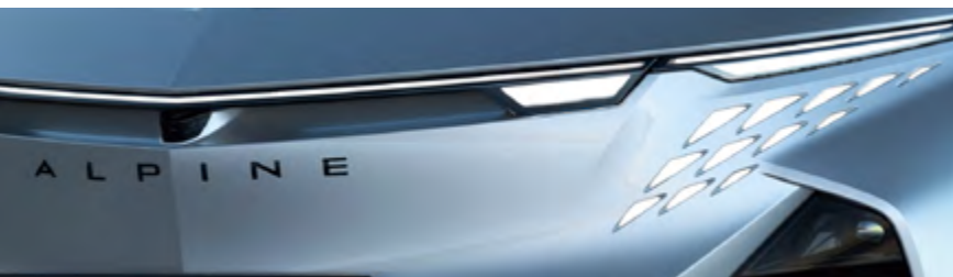
ARGENT MERCURE 1