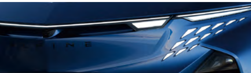
BLEU ABYSS 1